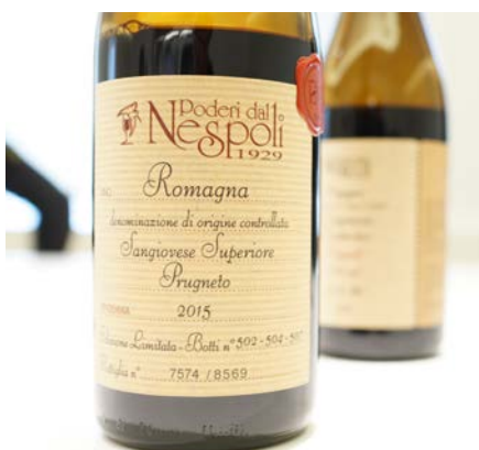
Tradition mit Schwung: Poderi dal Nespoli

Ökologischer Anbau ist für solche große Gruppen eine besondere Herausforderung, der sie sich mit immer mehr Engagement stellen. Ebenfalls stark engagiert in der Region ist Cevico, Nummer drei unter den