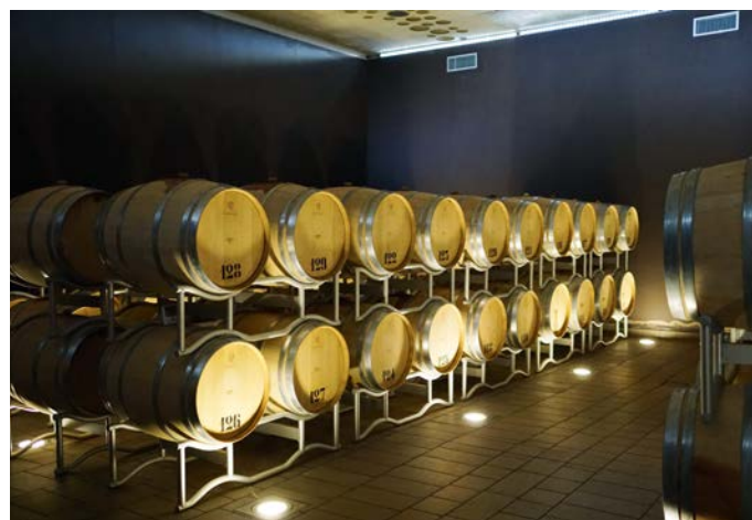
Holz und Hightech bei Campodelsole: Das 75-Hektar-Gut beherrscht den Stilfächer vom weißen Pagadebit bis zum Bordeaux-Blend