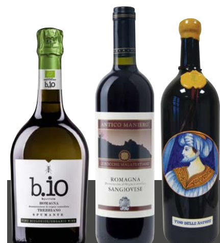
Exemplarische Romagna-Vielfalt aus dem Sortiment von Cevico