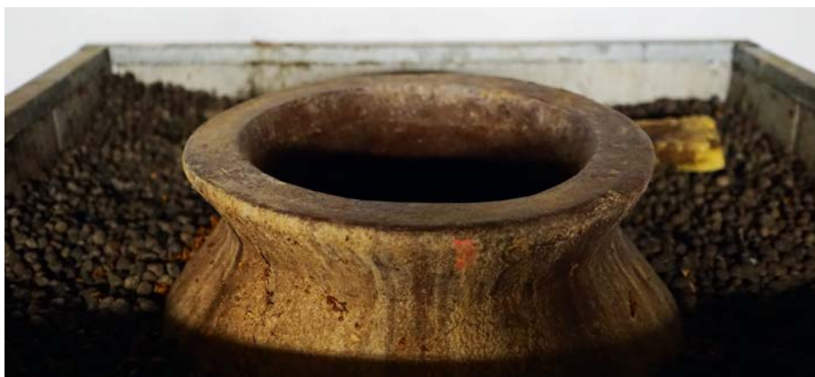
Ursprünglich: Auch in der Romagna spielt Amphoren-Ausbau eine Rolle

so eine andere, die Frucht von kandierten Orangenzensten, getrocknetem Ingwer und Aprikosen, Tabak und Honig unterscheidet sich deutlich. Doch hier wie beim über 15 Tage maischevergorenen, im Edelstahl ausgebauten und biologisch erzeugten Albana Vina Rocca vom selben Weingut findet sich die Phenolik, das Salzige und Mineralische sowie der Trinkfluss erzeugende Druck im Abgang.